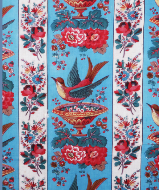
Couvre-lit, XX e siècle, toile de coton imprimée, manufacture portugaise © Collection Pereira de Sampaio, CTPS-075

Découvrez le programme inédit d'animations autour de cette exposition patrimoniale !